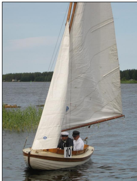
Bild 6 Bagatell i Monäs vassen år 2015, 103 år gammal.